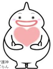
島原守護神 しまばらん

https://www.city.shimabara.lg.jp/page2862.html